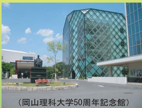
(岡山理科大学50周年記念館)